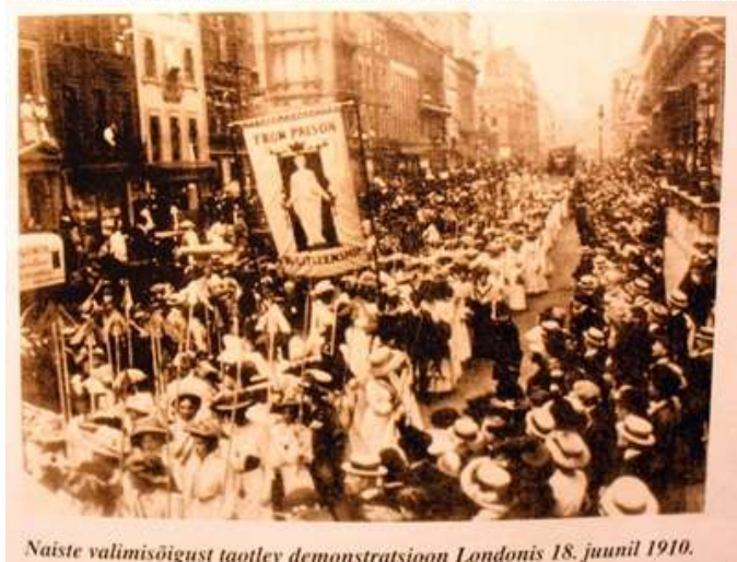
Õpik 3, lk 20