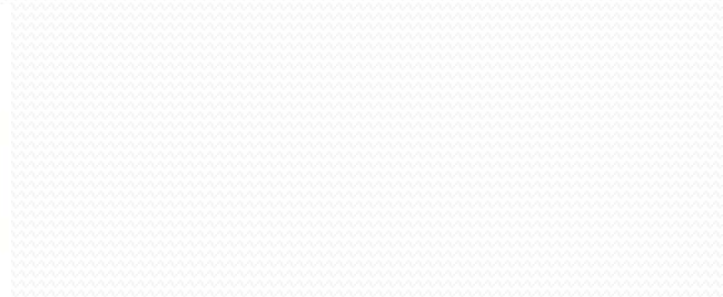
Taas sini-must-valgega Otepää poole (1994)