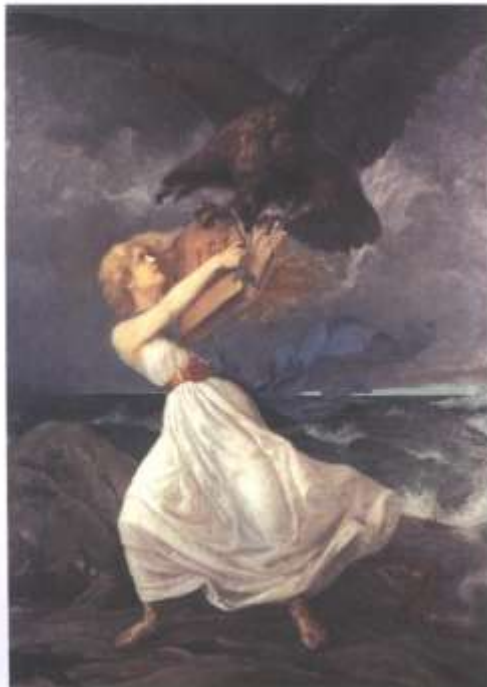
Soome kaitseb oma autonoomiat (E. Isto allegooriline maal, 1899)