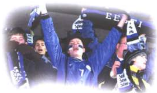
Õpik 1, lk 236