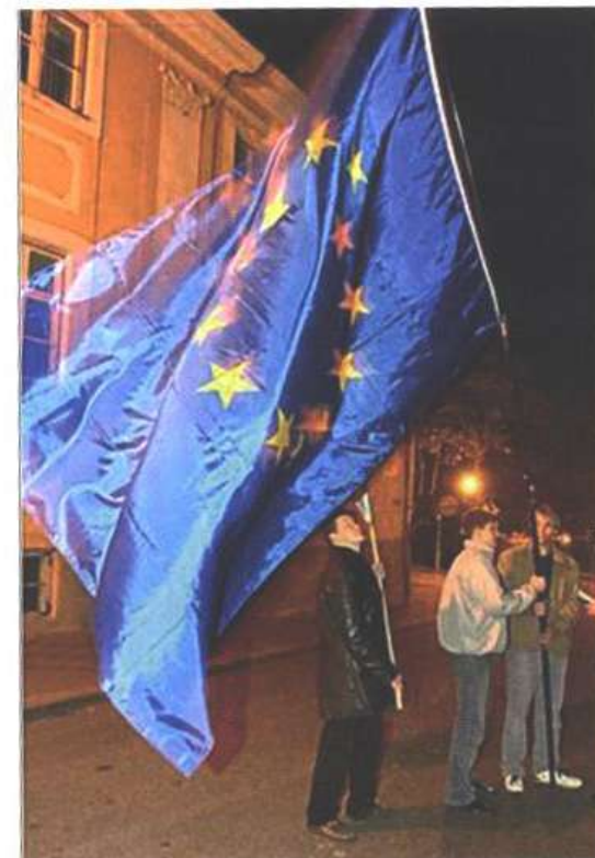
Õpik 1, lk 325