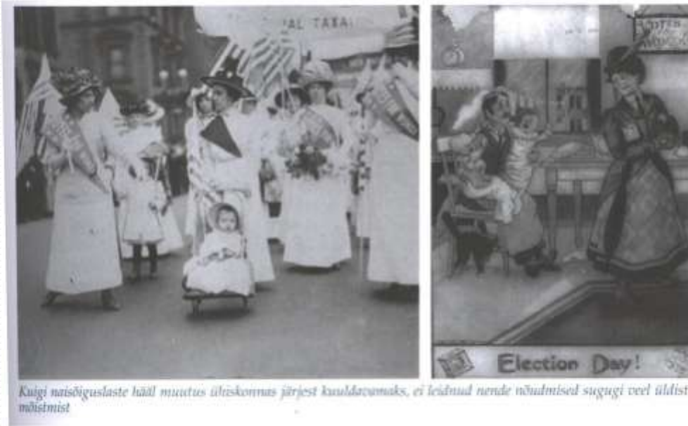
Õpik 2, lk 27