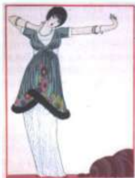
Mood 1914. a