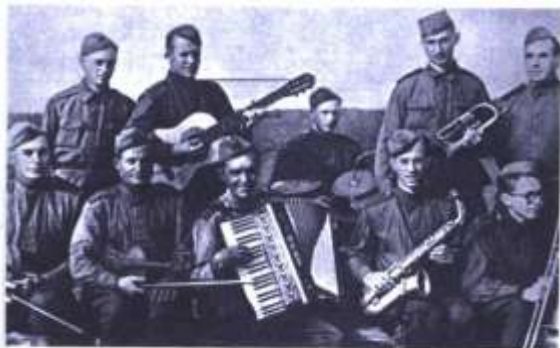
Eesti Laskurkorpuse mehi