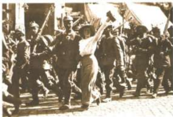
Üks Saksa kaudisõjaväe meestest matritsi sõja esimestel päevadel võimustanud rahvahulga saate Berliini raudteestaamise protse.