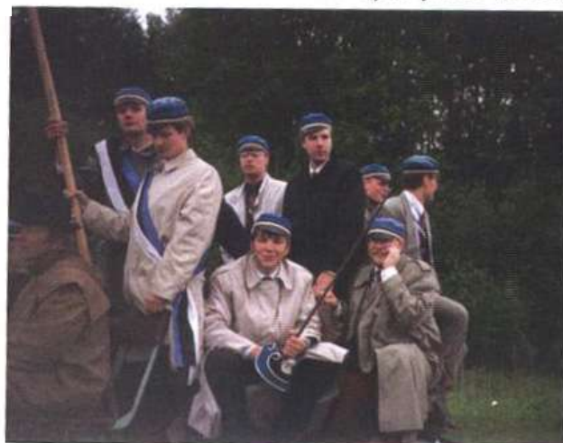
Õpik 1, lk 177