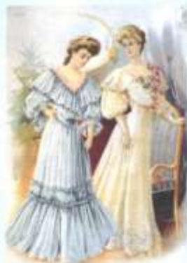
Mood 1908. a